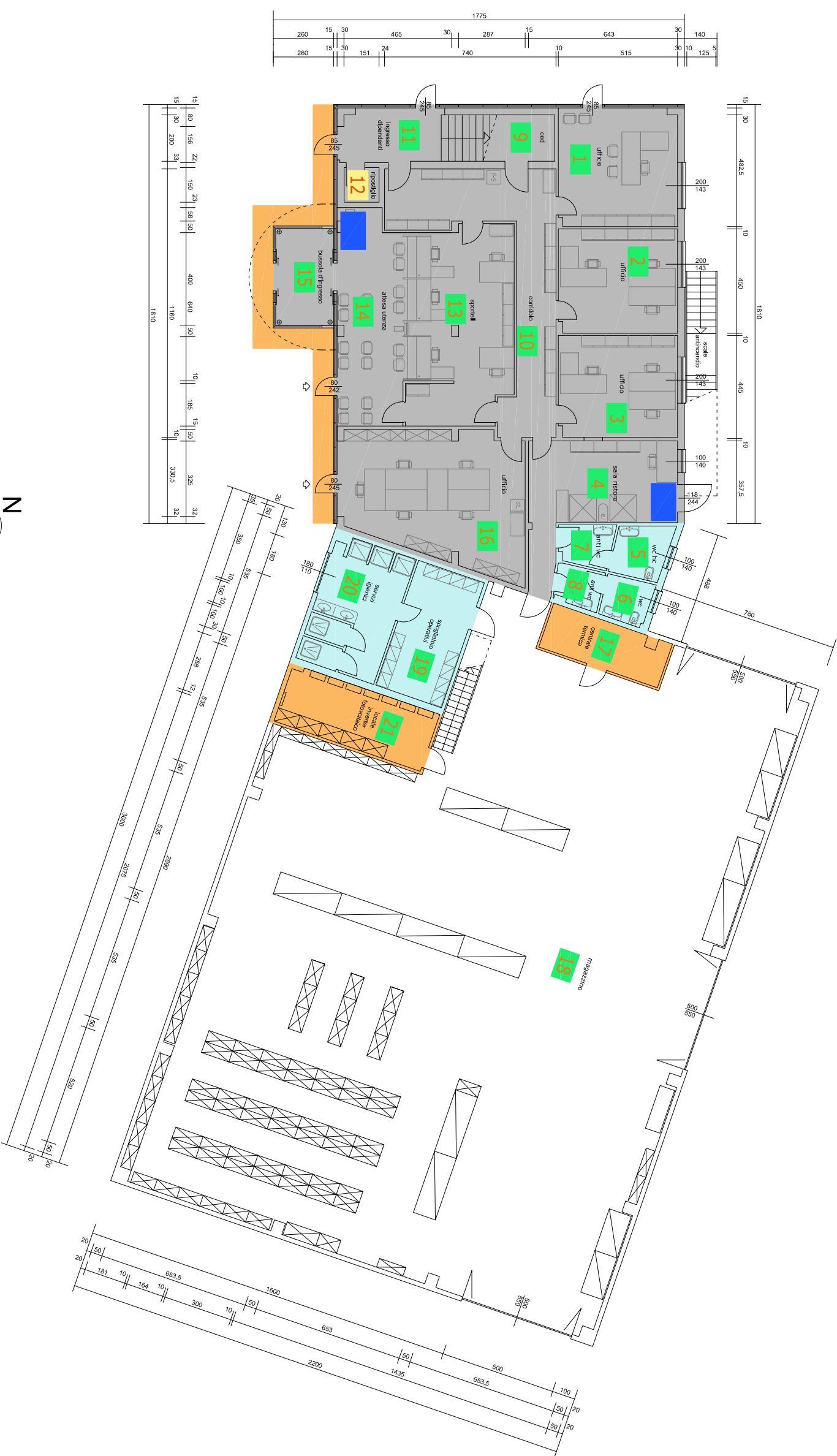
PIANTA PIANO TERRA - SCALA 1:200