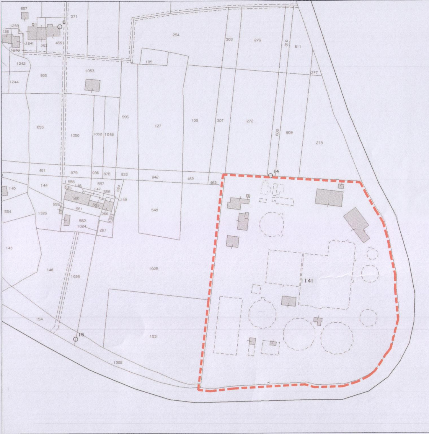
ESTRATTO DI MAPPA Comune di Treviso fg.47, mapp.1141 - scala 1:2000